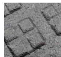
Profilo Multisquare nel lato inferiore