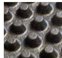
profil en crampons coniques