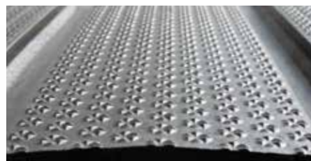
surface optiGrip, bombée avec pente