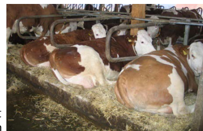
bon état d'entretien