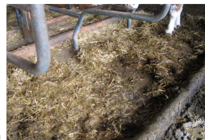
mauvais état d'entretien