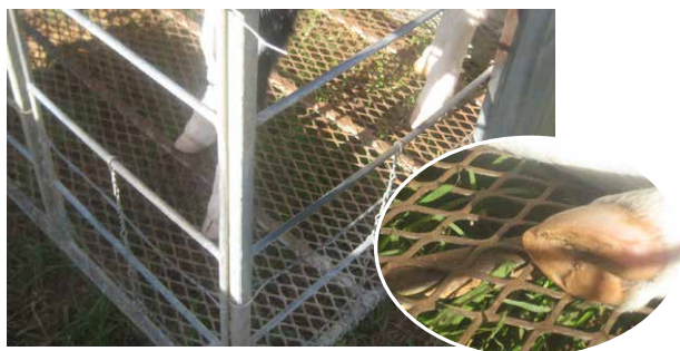
Подът е метална решетка