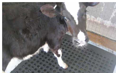
Подът покрит с CaVoMat

Гумената постелка се поставя директно върху решетката без фиксиране: