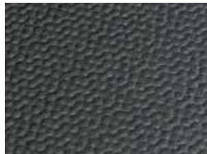
Oberseite: Hammerschlag-Profil surface: pebbled profile