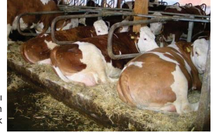
İyi bakımlı saman yatak