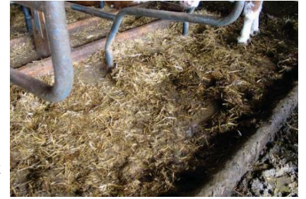
Kötü bakımlı saman yatak